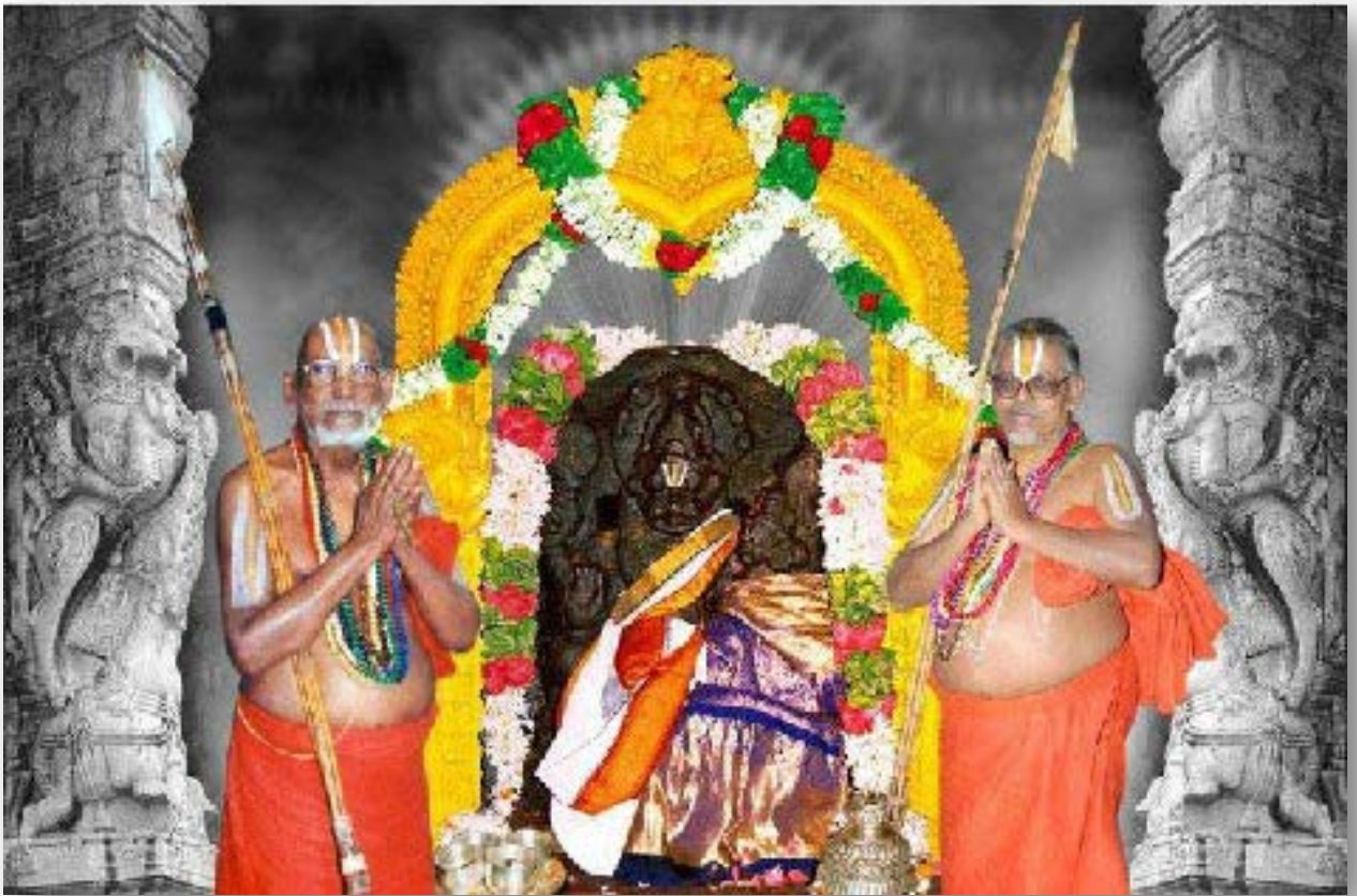
Picture above: Left: HH 45 th Pattam Srimad Azhagiyasingar Right: HH 46 th Pattam Srimad Azhagiyasingar